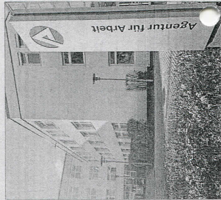
Im Januar 2026 verzeichnet der Agen-

Weiden. (jfe) Die Arbeitslosigkeit im Bezirk der Agentur für Arbeit Weiden ist im Januar 2026 gestiegen. Laut dem Bericht der Agentur waren insgesamt 5747 Menschen arbeitslos gemeldet. Das bedeutet einen Anstieg von 628 Personen oder 12,3 Prozent im Vergleich zum Dezember. Im Vergleich zum Vorjahr sind es 64 Personen mehr, was einem Anstieg von 1,1 Prozent entspricht. Die Arbeitslosenquote liegt nun bei 4,8 Prozent, 0,6 Prozentpunkte höher als im Vormonat und leicht über dem Vorjahreswert von 4,7 Prozent.